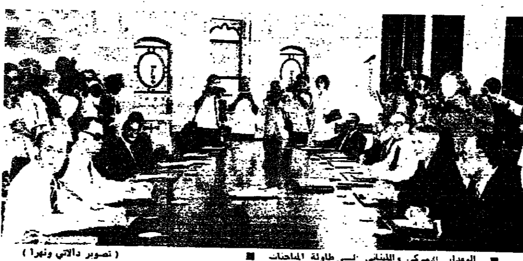
الوفدان الأميركي والليبناني في طاولة المناقشات